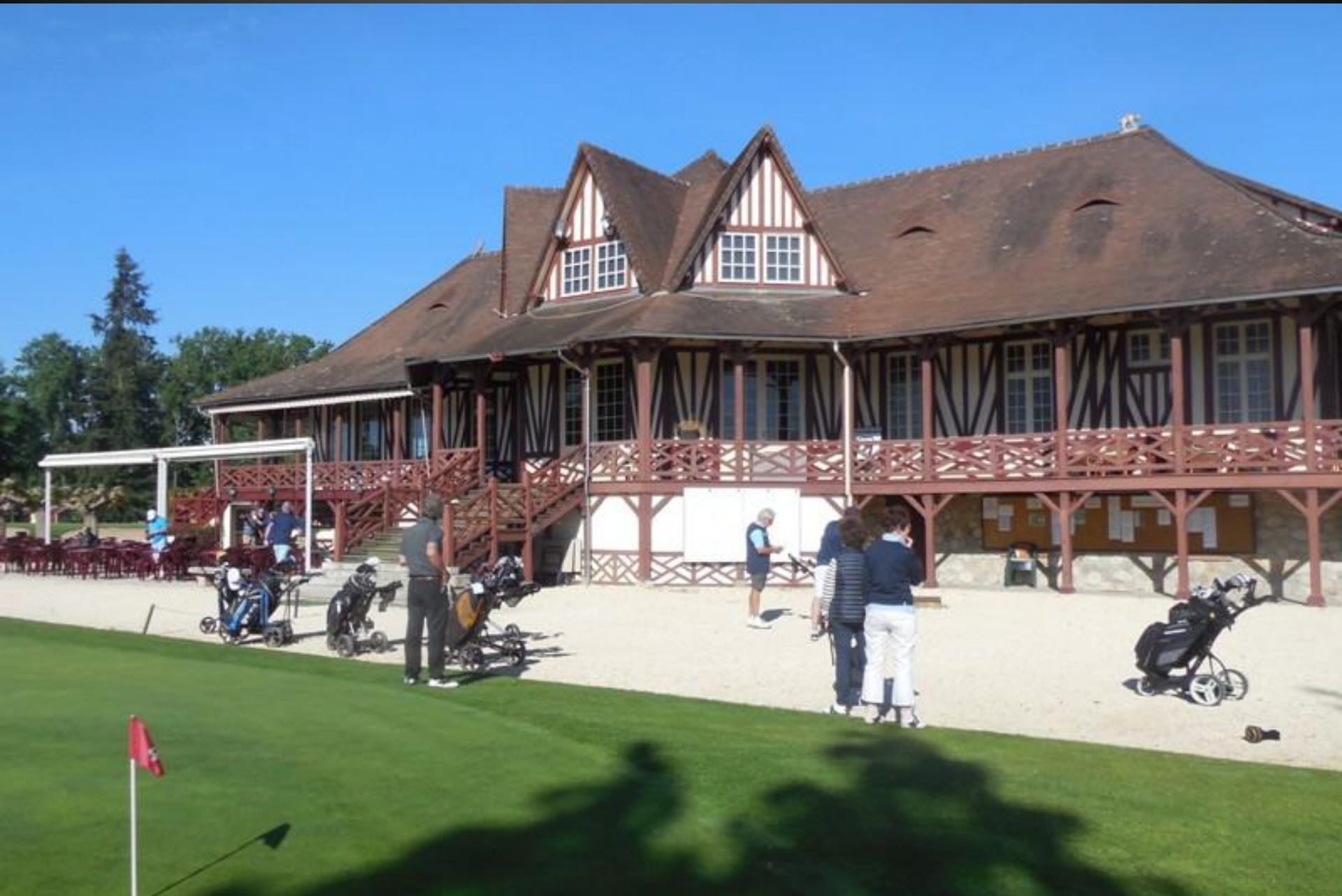
Un Club house classe