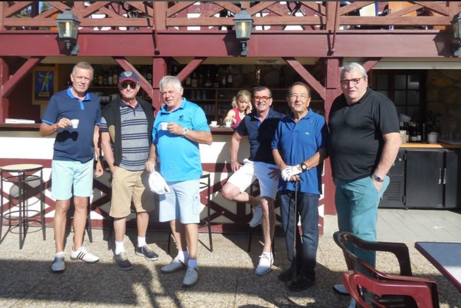
Un petit café avant le départ