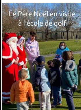
Le Père Noël en visite à l'école de golf

Nous ferons tout pour faire vivre notre club dans la meilleure ambiance possible, et on compte sur vous tous pour participer au mieux à cette ambiance habituellement si sympathique et conviviale.