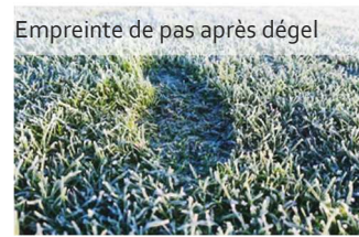
Empreinte de pas après dégel

Une partie de 4 joueurs = minimum 300 pas sur un green. Une étude de l'USGA (United States Golf Association) montre qu'un golfeur qui porte son sac piétine environ 120m 2 (soit 10 fois moins que pour tirer un chariot).