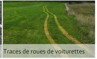
Traces de roues de voitures