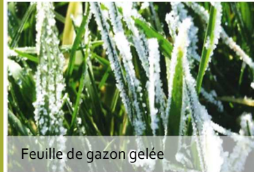
Feuille de gazon gelée

Lorsque le gazon meurt, il laisse place à la terre qui devient instable et boueuse par temps de pluie. En hiver, le gazon ne pousse pas, ne se régénère pas, et les dégâts s'accumulent autour des départs et des greens.