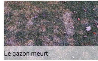
Le gazon meurt