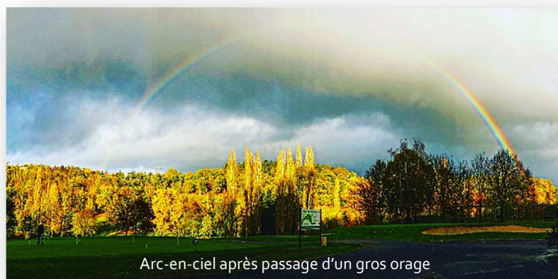
Arc-en-ciel après passage d'un gros orage