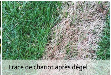
Trace de chariot après dégel