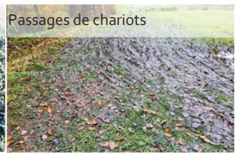
Passages de chariots