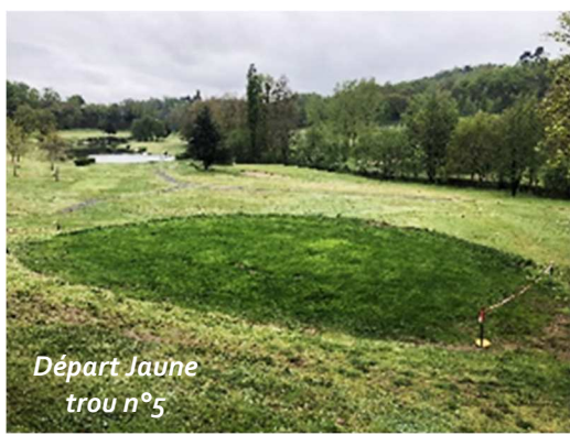
Départ Jaune trou n°5

Départ Jaune trou n°5 et départ Dames trou n°11 :