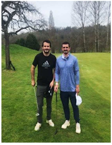
10 ans séparent ces deux photos ...