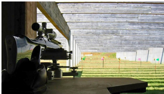
Carabine 22 LR utilisée en Rimfire

La Société de Tir Briviste a participé aux championnats départementaux et régionaux de la nouvelle discipline "Rimfire" qui se tire à 50 mètres avec appuis, au moyen d'une arme de calibre 22 Long Rifle sur des cibles représentant des blasons dont la mouche (le 10) fait 1 mm de diamètre !