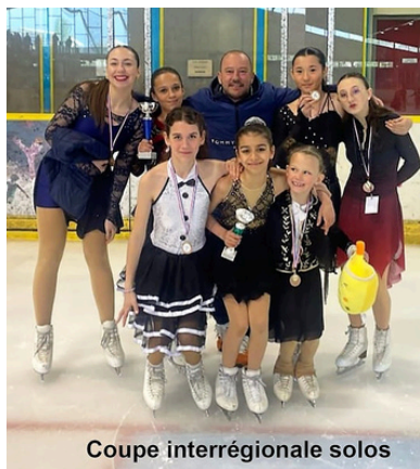
Coupe interrégionale solos

La Coupe Interrégionale Solos : pour cette finale, sur les 34 compétiteurs qui ont participé aux Tournois Interrégionaux de chaque zone, 7 se sont qualifiés. Voilà les résultats :