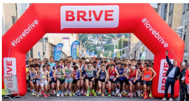
Départ 10km 2024

Cet évènement, ouvert à tous, propose un challenge enfants et les adultes peuvent s'inscrire en équipe d'amis ou de collègues .