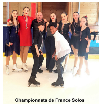
Championnats de France Solos