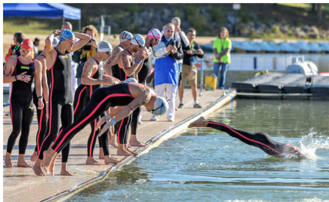
Coupe du Causse 2023

Retenez bien les dates : 21 et 22 septembre 2024 au Lac du Causse à Lissac-sur-Couze